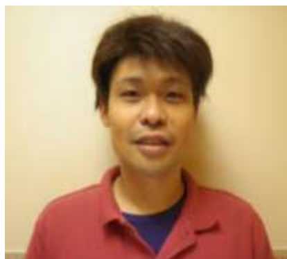
看護小規模多機能事業所 管理者